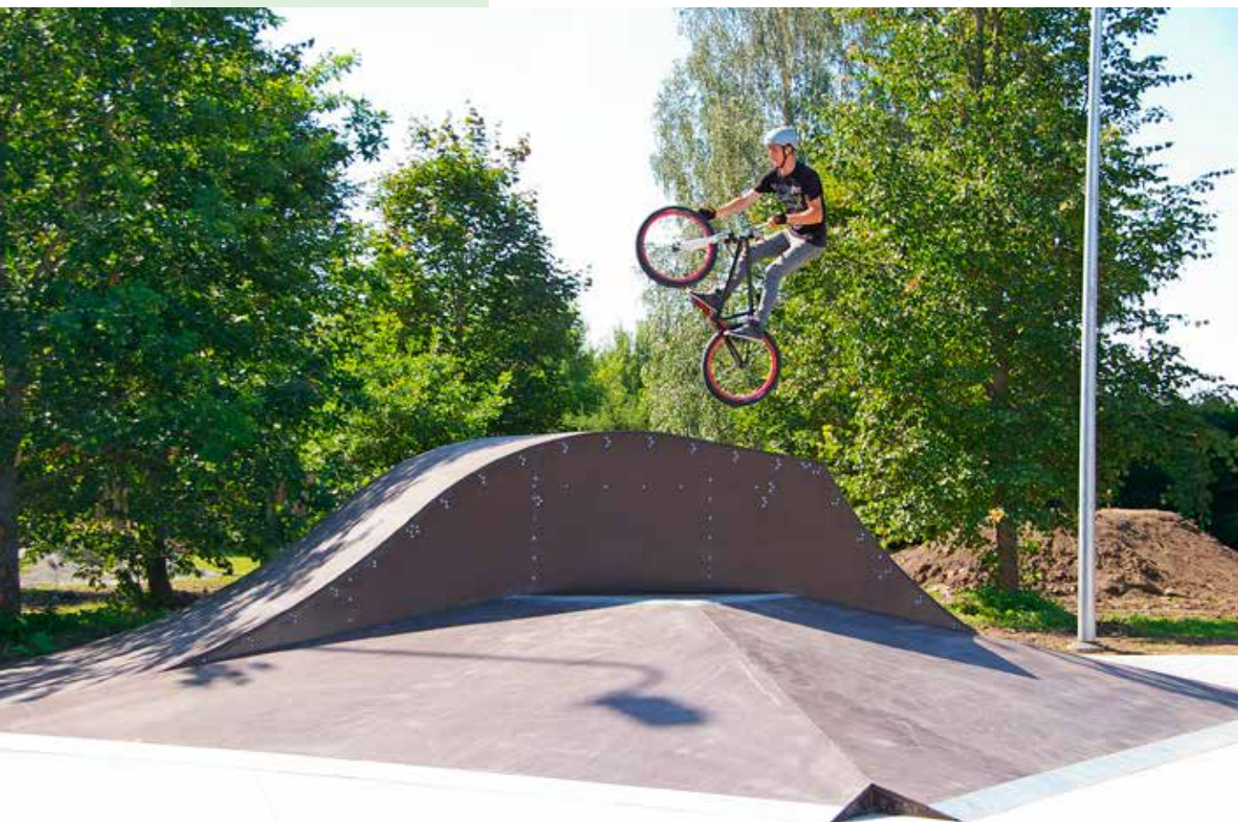
• Väätsa rulapark

Prioriteet number 2 oli „Kohaliku ettevõtluse, toodete ja turismi väärtustamine“ eesmärgiga ettevõtete omavahelise koostöö arendamine, toodete ja turismi väärtustamine, kohaliku ettevõtluse, omavalitsuste ning mittetulundusühingute koostööprojektide toetamine, turismiteenuste arendamine ning piirkonna vaatamisväärsuste korrastamine.