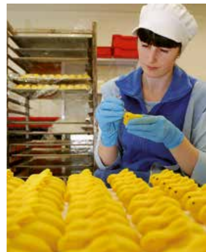
• Convi Foods OÜ martsipanitsehh

2014. a moodustasid tegevuspiirkonnas osäühingud 55,64% ettevõtetest, FIE-d 41,60% ja aktsiaseltsid 2,49%. Imavere ja Väätša valdades registreeritud ettevõtetest on suurim osakaal FIE-del, Imavere vallas 60,26% ja Väätša vallas 51,25%. Türi vallas on enim osäühinguid: 59,77%. Aktsiaseltside osatähtsus on piirkonnas väike.