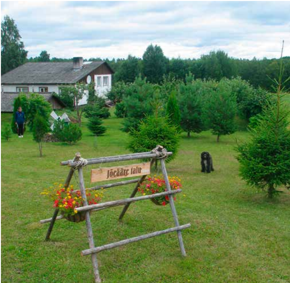
• Jõeääre talu Türi vallas