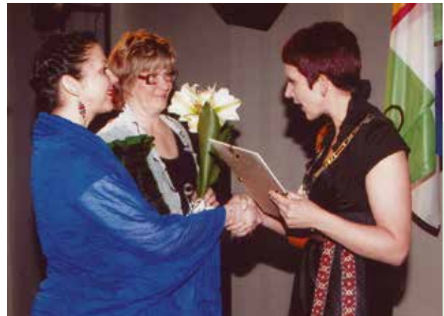
• Türi valla tunnustuse võtavad vastu avatud talude päeva korraldajad