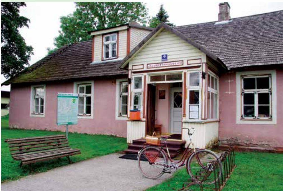
• Väätša jalgrattamuseum