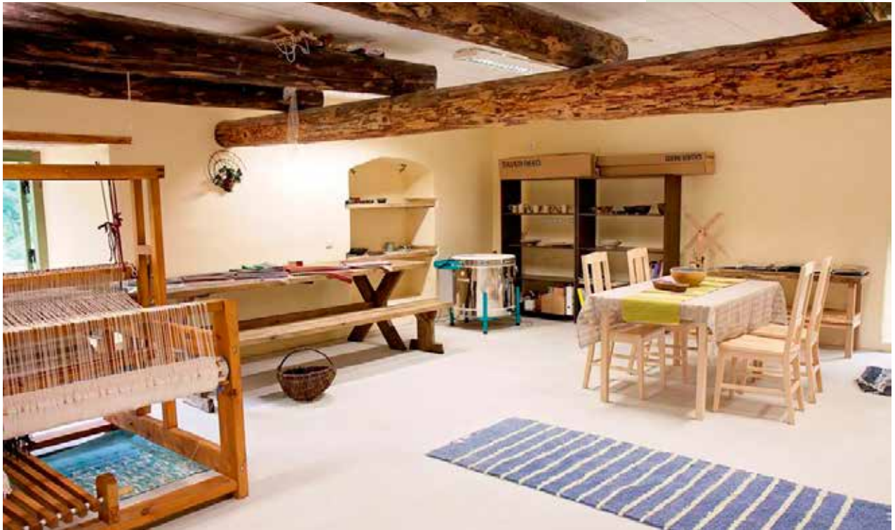
• Eistvere mõisa käsitöötuba