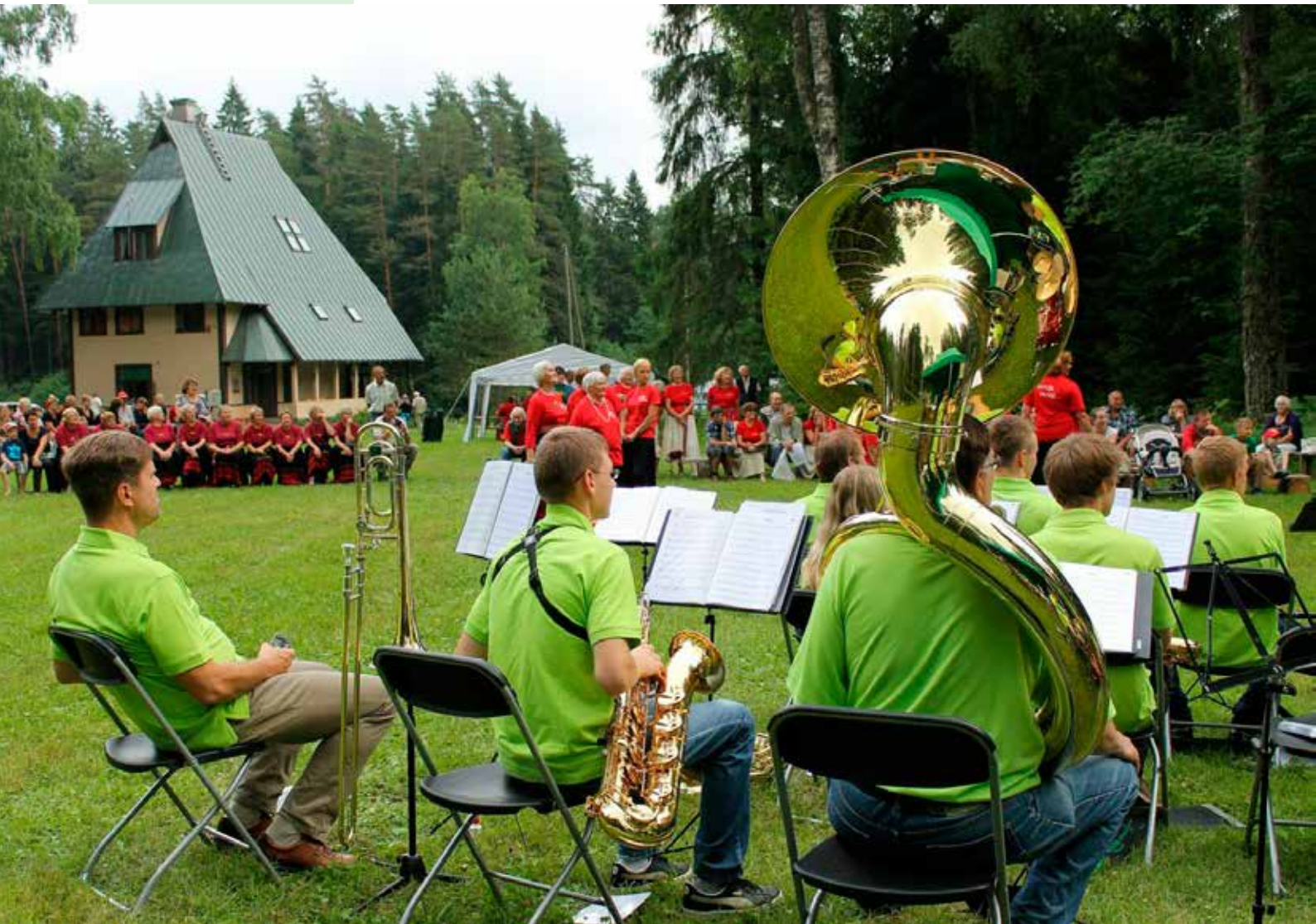
◆ Külade päev