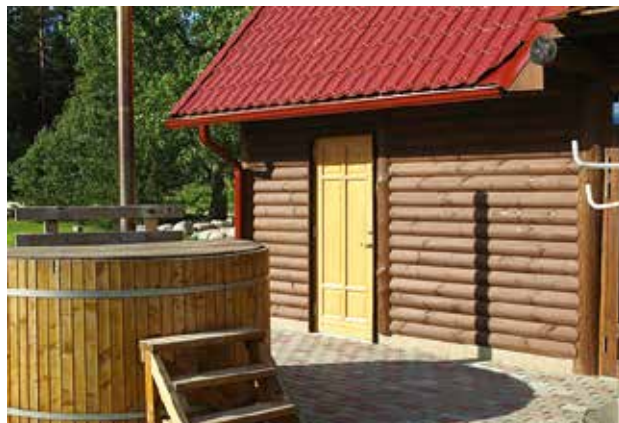
• Metsajõe Puhkemaja

2009-2014 tegeleb kogu tegevuspiirkonna ettevõtetest põllumajanduse ja metsandusega 29,40%, hulgi- ja jaekaubandusega 14,17%, ehitusvaldkonnaga tegeleb 9,71% äriühingutest. Esindatud on peaaegu kõikide tegevusvaldkondade ettevõtted. 2009-2014 on suurenenud 38 ettevõtte võrra EMTAKi klassifikaatori järgi muud teenindavad tegevused, juurde on tulnud 36 ehitusettevõtet ning 28 uut hulgi- ja jaekaubandusettevõtet. Edasi lisanduvad pingeritta haldus- ja abitegevused, kunst-meelelahutus-vaba aeg, töötlev tööstus jne.