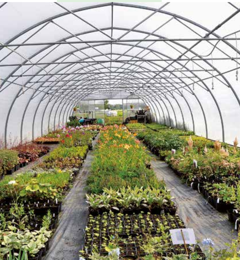
• OÜ Elise Aed kasvuhoone